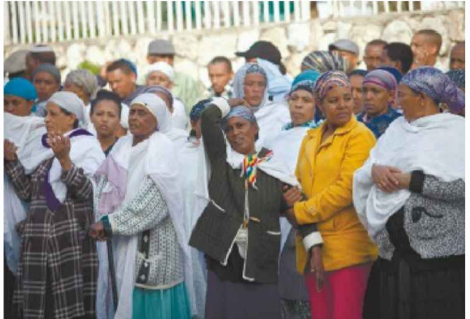
זירת הרצח וההתאבדות של בני הזוג מיטיקו, בראשון לציון ב-2014