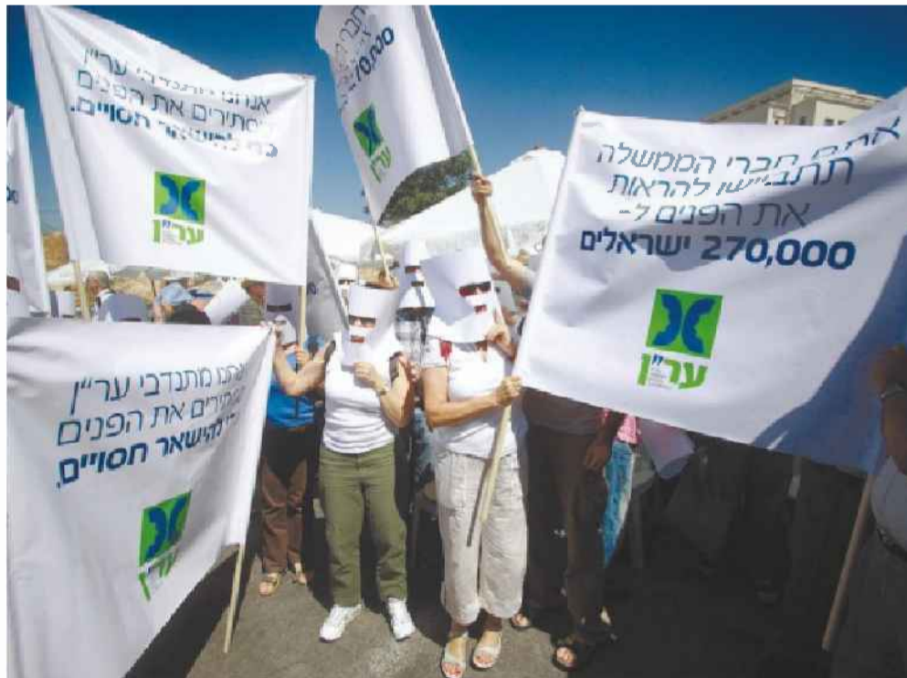
פגנת מתנדבי ער"ן מול משרד ראש הממשלה, ב-2009

כשליש מהמתאבדים מדי שנה הם עולים, אך לרבים אין גישה לסיוע הנפשי הראשוני בטלפון בגלל מחסום השפה. למרות פניות, המשרדים הממשלתיים מסרבים לתקצב מתנדבים באמהרית, צרפתית ורוסית